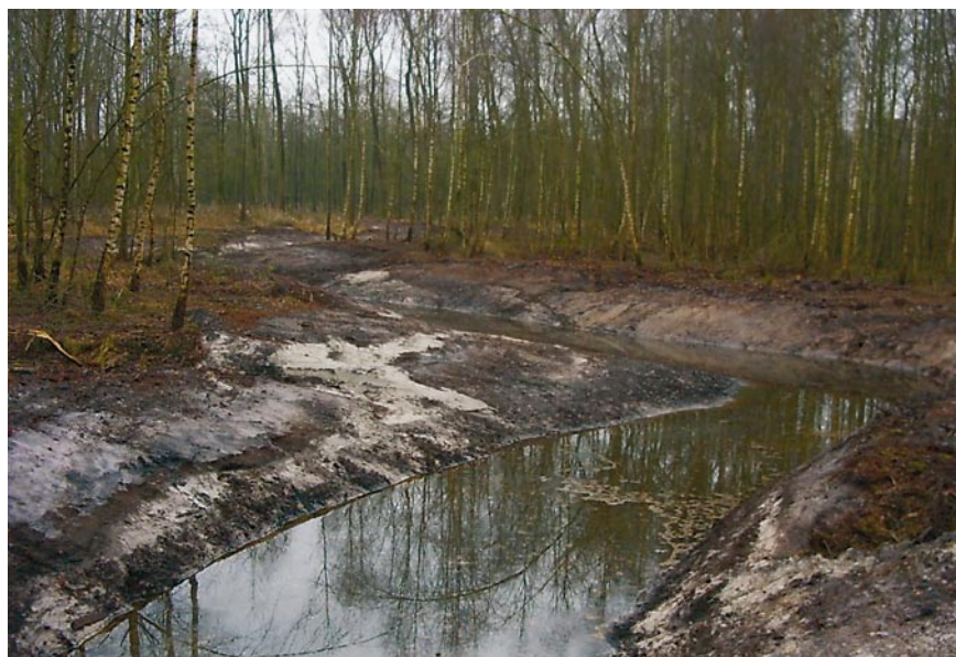
Bild 1: Abgeschlossene Baumaßnahmen der wieder ermöglichten Mäandrierung eines Abschnittes des Tongelreep. Ein Projekt des Wasserverbandes De Dommel, Niederlande.